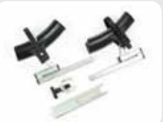
Accessoire vélo enfant

Vous avez perdu une pièce de votre Twinny Load? Aucun problème! Vous pouvez toujours la commander au point de vente Twinny Load le plus proche.