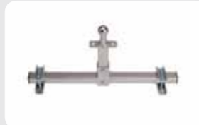
Accessoire caravane haut/bas