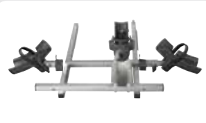
Supplément 3e vélo

Il est toujours possible d'équiper votre Twinny Load des accessoires suivants: visitez notre site internet pour découvrir les possibilités par porte-vélos.