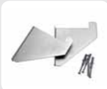
Support mural universel